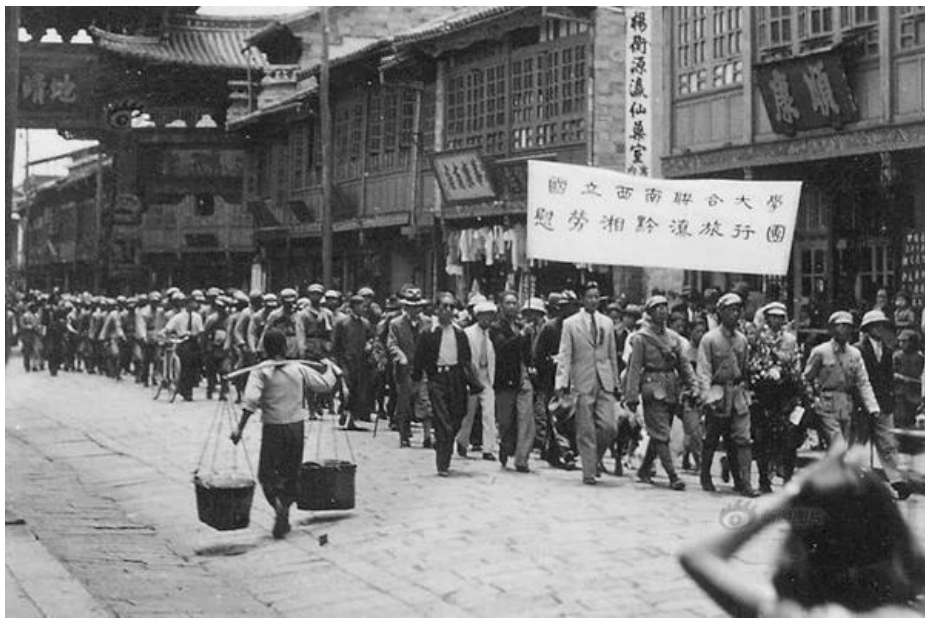
拾遗：唯才是举——这就是西南联大的用人标准。“1939年，我在西南联大入学那年，学校又干了一件震动全国的大事，聘请钱锺书、华罗庚、许宝騄当了正教授。那一年，这三位先生都只有28岁。”“翻译文化终身成就奖”得主何兆武说。