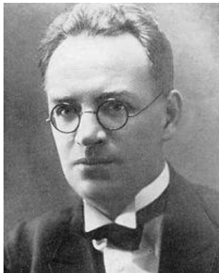
鲍里斯·安德列耶维奇·皮利尼亚克

鲍里斯·安德列耶维奇·皮利尼亚克(1894年10月11日，-1938年4月21日)，死刑。