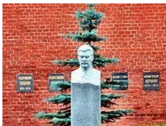
约瑟夫·维萨里昂诺维奇·斯大林

斯大林说：“我不明白，列宁为什么找克鲁普斯卡娅这么平庸的女人作为伴侣!列宁是一位了不起的秘密工作者，他一直隐瞒地与伊涅萨·阿尔曼德，五个孩子的母亲维持暧昧的关系。”(伊涅萨·阿尔曼德1875-1920因伤寒去世)(第263页)