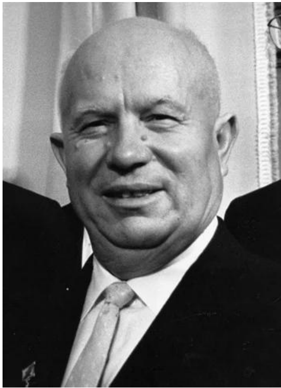
尼基塔·谢尔盖耶维奇·赫鲁晓夫

尼基塔·谢尔盖耶维奇·赫鲁晓夫(1894年4月15日-1971年9月11日)，病逝。