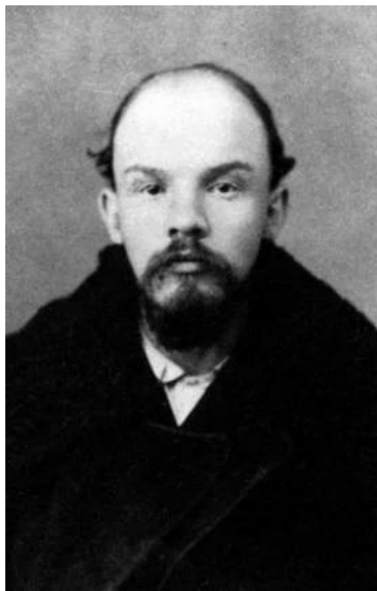
弗拉基米尔·伊里奇·列宁

当斯大林和维娜幽会时，一个在海滨浴场担任保卫的年轻红军战士被斯大林发现了。他自豪地回答斯大林的问话：“斯大林同志，奉命来保护您，以防内外敌人。”但斯大林认为是在秘密跟踪他，勃然大怒，于是这个红军战士被捕，立即秘密处决，以身殉职了。(第33页/第36页)