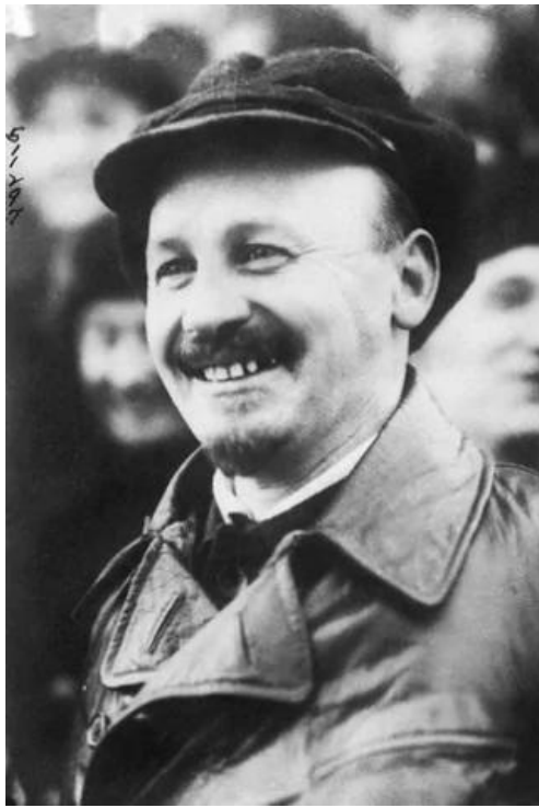
尼古拉·伊万诺维奇·布哈林

尼古拉·伊万诺维奇·布哈林(1888年10月9日-1938年3月14日或3月15日)，死刑。