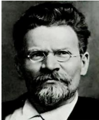
米哈伊尔·伊万诺维奇·加里宁

斯大林大清洗的导火线是基洛夫被暗杀，而基洛夫的声望在不断上升。在基洛夫死前不久，他是这样对维娜评论斯大林的：“他这个人很坏、残酷、狂傲、狠毒、爱报复、心胸极为狭窄。暂时我们不得不韬晦，但迟早要收拾他，撤掉他的一切职务。”(第103页)