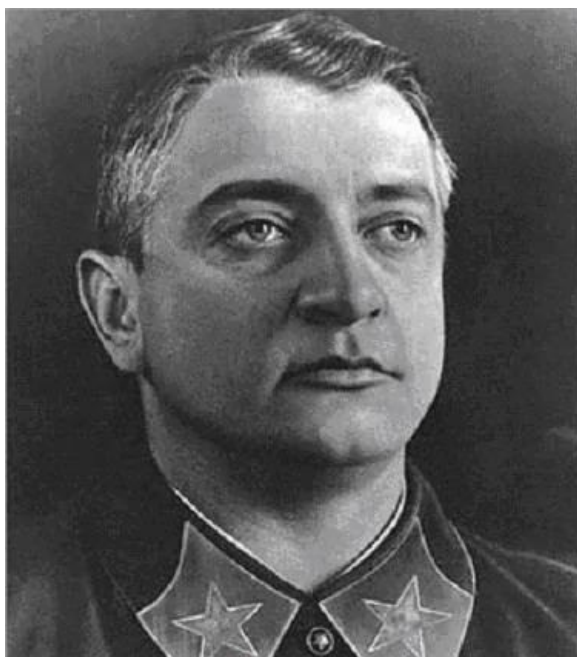
米哈伊尔·尼古拉耶维奇·图哈切夫斯基

事实上，1960年之后他的书就再版了，中国作家出版社在1998年出版了他的作品《红木》