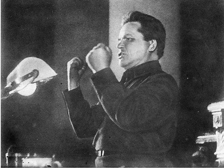
谢尔盖·米罗诺维奇·基洛夫

“我们和希特勒签订了互不侵犯和友好条约。舒伦堡大使(德国驻苏大使)告诉我们说希特勒及其总参谋部正在加紧备战，近期德国将不宣而战进攻苏联。我们不会中奸计。我建议把舒伦堡的情况告诉希特勒，因他出卖了顶头上司。”斯大林的眼睛射出了凶光。(第450页)