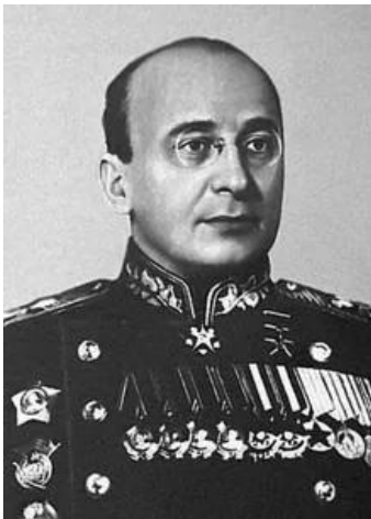
拉夫连季·帕夫洛维奇·贝利亚

拉夫连季·帕夫洛维奇·贝利亚(1899年3月29日-1953年12月23日)，死刑。