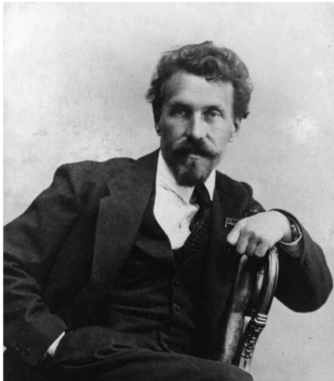
阿列克谢·伊万诺维奇·李可夫

据执行时在场的斯大林秘书波斯克列贝舍夫说：“布哈林、李可夫临死时，满口咒骂着斯大林。而且他们两个坏蛋是站着死的，倒下去没有在地上爬，也没有求饶过。(第367页)