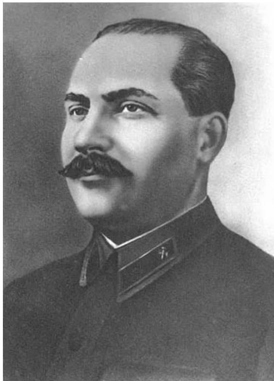
拉扎尔·莫伊谢耶维奇·卡冈诺维奇

“尼基塔·谢尔盖耶维奇，理想主义者卡尔·马克思和弗里德里希·恩格斯所幻想的共产主义何时才能在俄国实现?”“毫无疑问，不会如想象那么快。以后不是俄国，而是在苏联实现共产主义，这是有本质区别的。俄国现已不存在，它随同沙皇的遗体被埋葬了。”(第409页)