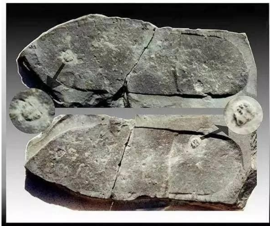
▲二亿六千万年前三叶虫上的鞋印

迄今可见的大型史前人类文明遗迹，埃及的金字塔、墨西哥古玛雅人的金字塔、玻利维亚的帝华纳科古城遗址、秘鲁萨克塞华曼城堡也许是杰出的代表了。这些巨石建筑体现了一个天文、建筑、冶金等技术超过现代人的文明。