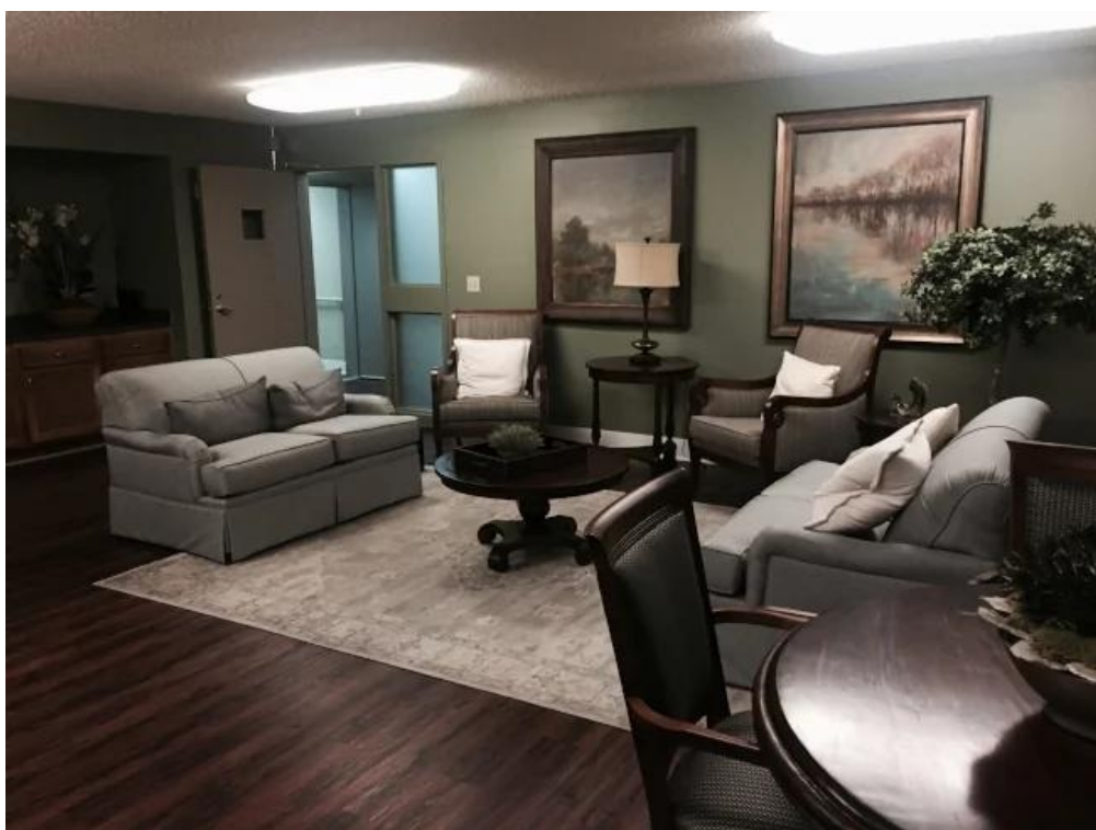
老人公寓里的二楼客厅。