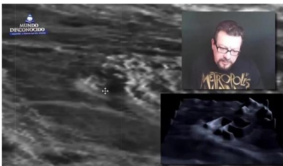
3D分析显示结构为整齐的几何形状（视频截图）

视频中显示，这些结构的形状和地球的高楼大厦很类似，长方形、正方形、圆形等等，在金星表面到处可见，有的连成片，有的孤立存在。