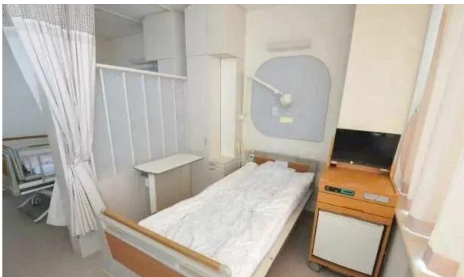
综合医院的病室，也是普通病房

另外，日本住院的环境也很舒适，下面的是日本医院的设施情况，其实都是比较普通的大学医院，所以应该也代表了普遍情况吧：