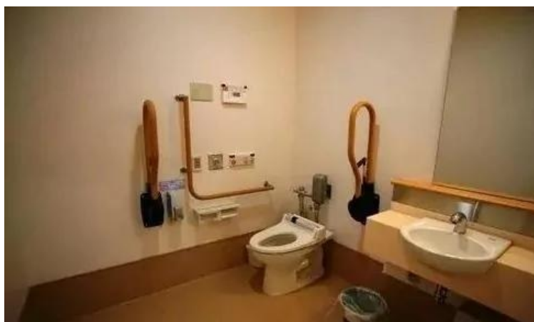
病室的卫生间，到处都是护士呼叫装置