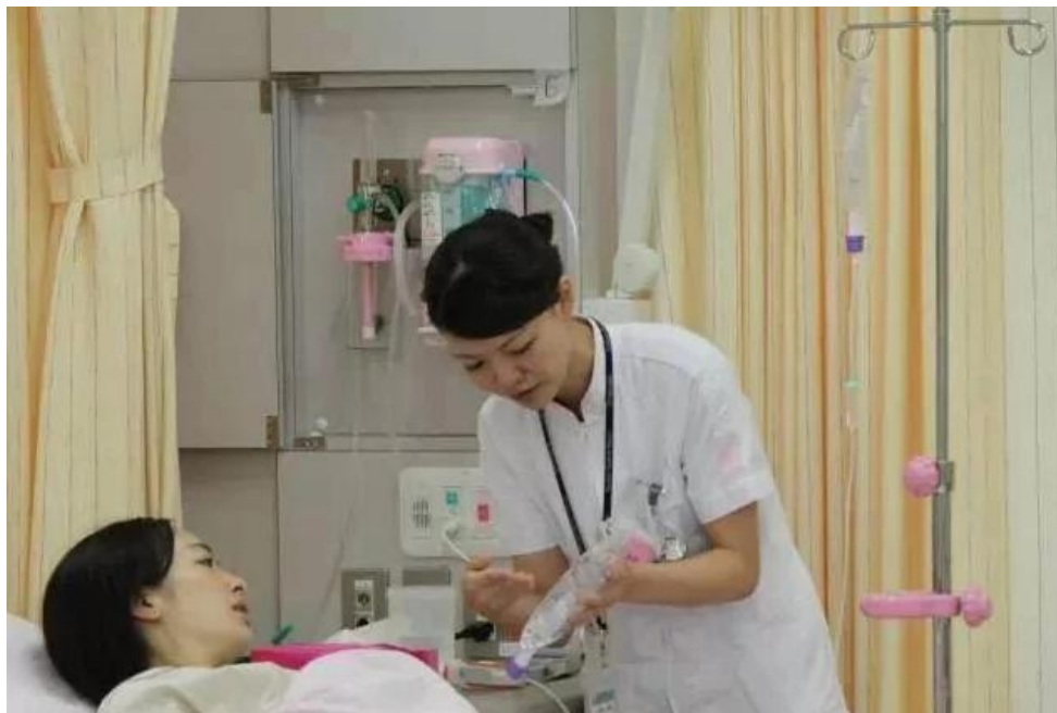
日本医院的护士在工作