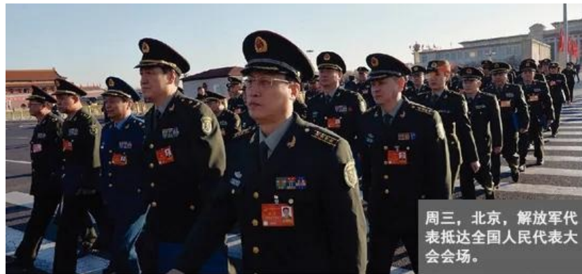
周三，北京，解放军代表抵达全国人民代表大会会场。